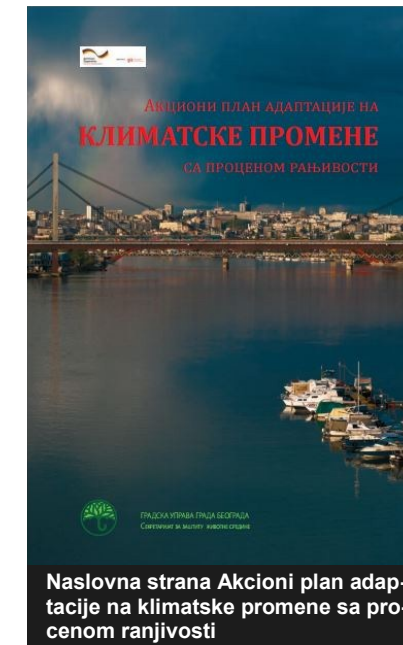
Naslovna strana Akcioni plan adaptacije na klimatske promene sa procenom ranjivosti

Uočljivo je da se svest donosilaca odluka na državnom i lokalnom nivou, kao i svest građana, menja u pravcu boljeg razumevanja potrebe za energetske efikasnošću i zaštitom životne sredine. Međutim, iako je u Srbiji realizovan značajan broj projekata iz ove oblasti, uz usvajanje određenog