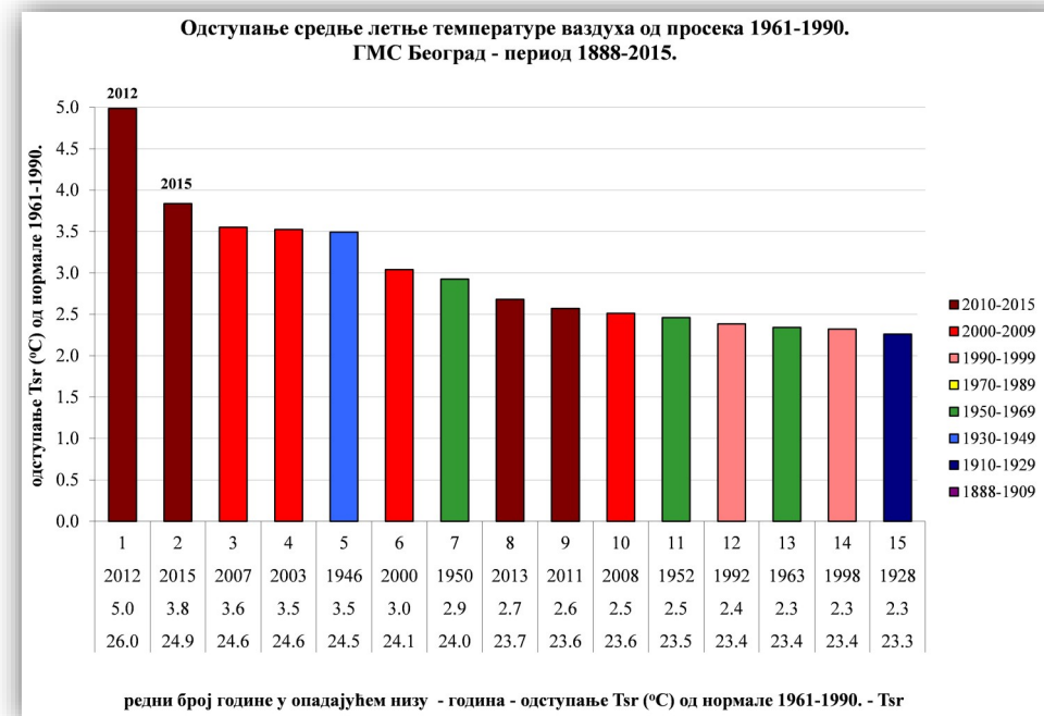
redni broj godine u opadajućem nizu - година - odstupanje Tsr (°C) od normale 1961-1990. - Tsr

Republički hidrometeorološki zavod Srbije je u saradnji sa Institutom za javno zdravlje Srbije „dr Milan Jovanović Batut” razvio sistem za rano upozorenje na pojavu toplotnih talasa.