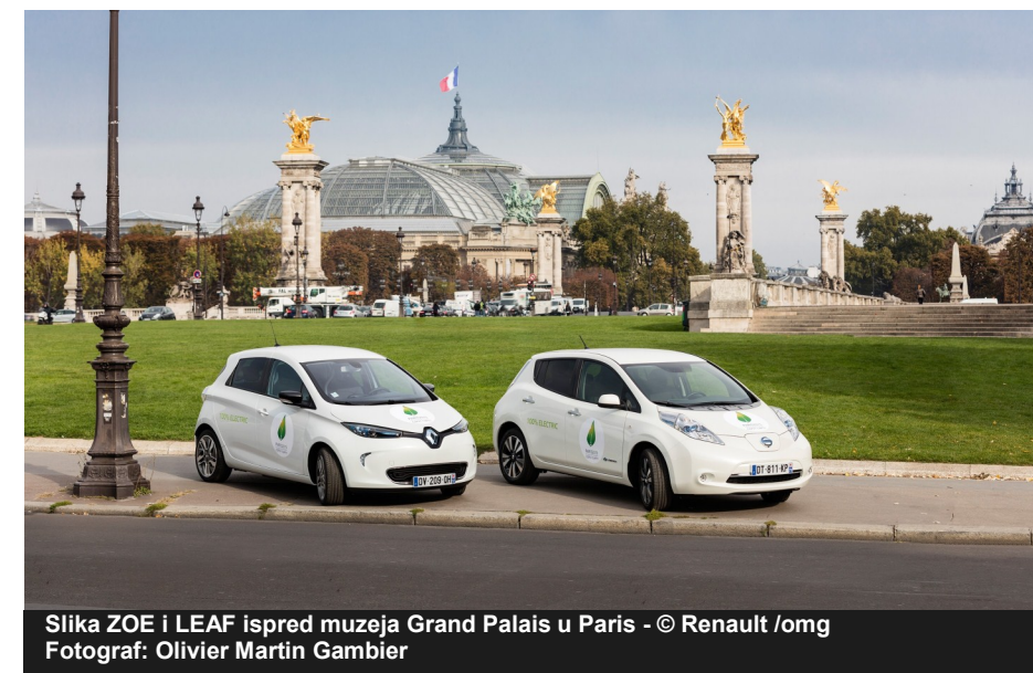
Slika ZOE i LEAF ispred muzeja Grand Palais u Paris